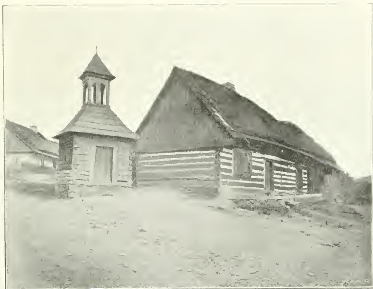
Obr. 103. Ostrovec. Dřevěná zvonička.

Sedláček, Hrady a zámky VI., 268. — A. Drachovský, Obr. Zbir. 56; Pol. a škol. okr. Rok. 330