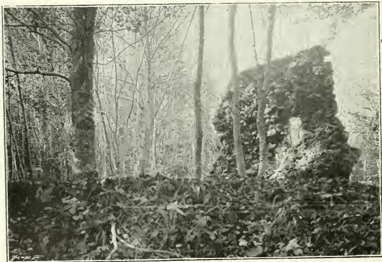
Obr. 105. Padrť. Zbytek zdiva na straně severovýchodní (pohled se str. jižní)

mezeru 1·5 m . Dále na západ jest čtvercová prohlubina as 9 m šir. a dlouhá rovněž lánaným kamením obklopená i naplněná. Na straně východní zachovaly se nepatrné zbytky zdiva (viz půdorys na obr. 104.). Největší kus jeho stojí na straně severovýchodní. Jest 3·15 m vys., as 4·20 m dlouhý a asi 1 m silný. Skládá se z kamene lánaného, maltou spojovaného. Zdivo