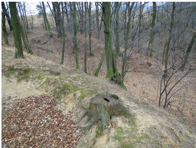
↑ Pohled ze sídelní plošiny na příkop a vnější val. Foto J. Důbravčík 2015