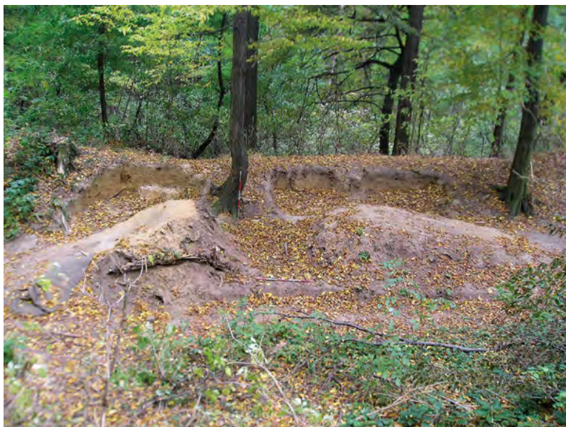
↑ Ukázka devastace vnitřního prostoru hrádku. Foto J. Janál 2005

nejmladší doposud známé hmotné prameny spadají do 15. století, ale na základě písemných pramenů je možné předpokládat, že lokalita existovala ještě i na počátku 16. století. [dv]