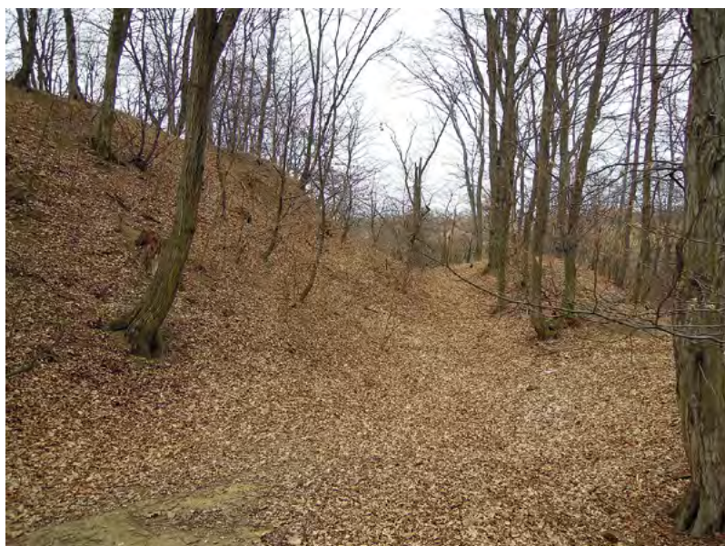
↑ Sídelní pahorek hrádku s příkopem a vnějším valem.