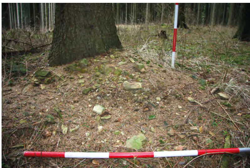
↑ Vytěžená hornina – hlušina. Foto P. Macků 2015

Literatura: Nekuda 1961; Měřínský 1977, 1978, 1984; Nekuda – Unger 1981; Merta 1984; Houzar – Škrdla – Vokáč 2007.