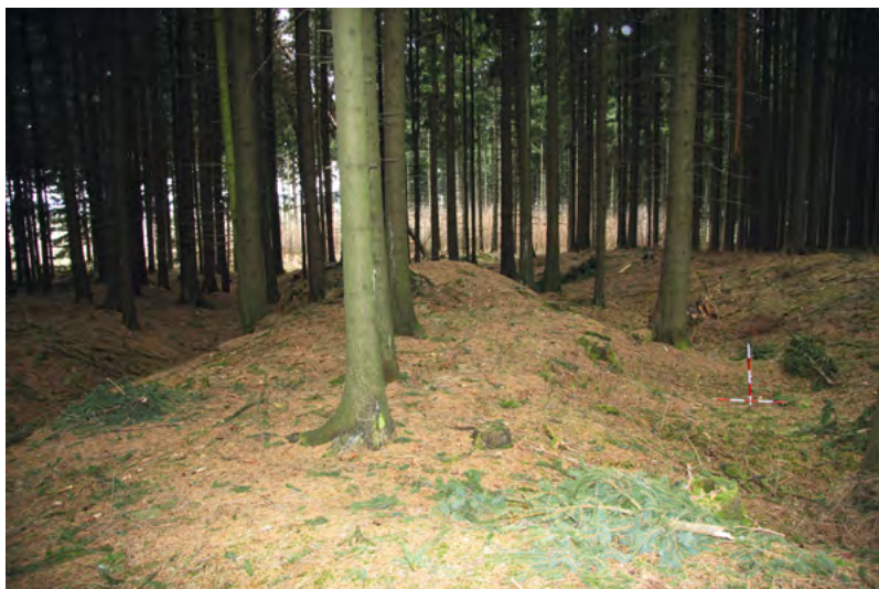
↑ Dvě z oválných pink.