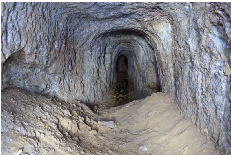
↑ Štola Liščí díra, důlní chodba.