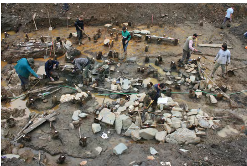
↑ Archeologický výzkum realizovaný v roce 2014 v souvislosti s přístavbou penzionu Holzberg.

staršího středověkého objektu se strážní funkcí: N 50°1'10.97", E 17°18'32.53" (6 km).