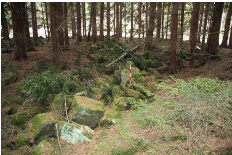
↑ Na severní straně je příkop zasypán kameny, které mohou pocházet z původní obytné stavby.

voda, která je sváděná do bezejmenného potoka zahloubenou stružkou v jihovýchodním rohu tvrziště. Na západní straně je příkop zasypán velkými lomovými kameny, které snad mohly být kdysi použity v rámci opevnění či jako součást samotné tvrze. Samotný pahorek je v závislosti na sklonu mírně vysvahaného terénu vysoký 2,8–3,5 m. Motte je narušeno výkopy hledači pokladů (většinou na svazích k příkopu) a jednou amatérskou sondou o přibližných rozměrech 3 × 2 m a hlubokou 1 m. V této zpětně nezasypané sondě je částečně narušena *kulturní vrstva, ze které vypadávají kousky mazanice a střepy keramických nádob. Vlivem eroze se sonda bohužel nadále rozšiřuje a pahorek postupně podléhá destrukci. [pm]