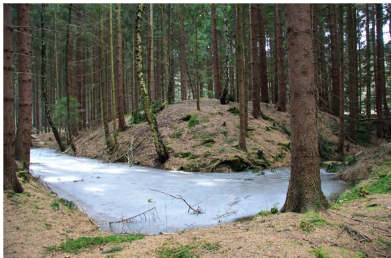
↑ Pohled na jihozápadní stranu tvrziště přes vodní příkop. 2015

Půdorysně se jedná o téměř pravidelný čtverec o rozměrech 11,5 x 11 m obklopený příkopem a valem, který však na západní straně plynule přechází v terén. Nelze určit, zda jde o pozdější zavážku nebo zde val jako takový nikdy neexistoval. Zemina získávaná při stavbě bývalé tvrže byla v podstatě přesouvána z kopaného příkopu jak na val okolo, tak na střed nad okolí vyvýšené obytné plochy. Val nedosahuje výšky ani jednoho metru a lze proto usuzovat, že přednost na využití vykopané zeminy tak byla dána výši středověkého pahorku. Příkop je po všech stranách dlouhý 9–10 m a tvoří čtvercový rám kolem pahorku. Na jižní, východní a severní straně se v příkopě drží