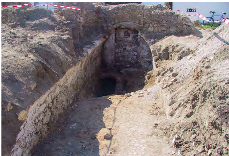
↑ Mikve v podzemní prostře odkrytá archeologickým výzkumem.