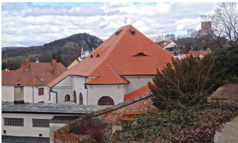
↑ Židovská čtvrť s Horní synagogou: v pozadí vlevo vrch Turoid, vpravo přesunutá věž na Kozím hrádku. Foto A. Knechtová 2015