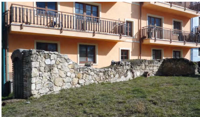
↑ Pozůstatky zdiva původního domu s novodobým vstupem do mikve v podzemní prostoře.

směrem. V jihovýchodním rohu suterénu se našla mikve. Sklep i mikve byly po ukončení výzkumu rekonstruovány a zpřístupněny novým vstupem, který se nachází u zadního traktu domu na ulici Brněnská 29. Necelý metr širokou nádrž obdélného tvaru se zaoblenými rohy tvoří v severní části obnovené přístupové cihelné a čtyři původní dřevěné dolní schody. Od nich pokračuje