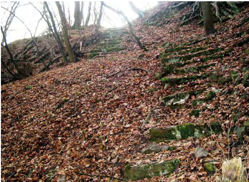
↑ Kamenné schodiště na jihovýchodní straně, současný vstup.

Literatura: Zháněl 1967; Zháněl 1967; Zháněl 1971; Plaček 2001.