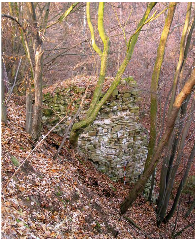
↑ Vnější opěrný pilíř hradby na severovýchodní straně hradu.

obklopovaly protáhlé nádvoří, dlážděné lomovým kamenem. Celý areál hradního jádra byl chráněn až 2,5 m silnou *hradbou. Podle charakteru zástavby celého obvodu a možnosti, že v jižním a západním nároží mohly existovat hranolové věže, usuzuje M. Plaček na podobnost s členěním přemyslovských *kastelů. Na severní straně v průčelí hradního jádra se nacházela hradní kaple, doložená obdélným výstupkem zdíva a pozůstatkem pilíře podírajícího arkýřové *presbyterium. Dokladem významu melického hradu je množství velmi zajímavých nálezů v prostoru hradní kaple – např. malovaných klenebních žeber, klenebního svorníku, fragmentů okenních kružeb a portálu. Dále zde byly nalezeny zbytky malovaných omítek s fragmenty nápisů, úlomky mramoru a štuku, kousky malova-