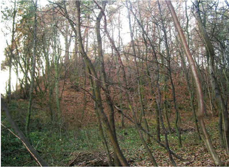
↑ Pohled na hrad Melice od západu. Foto T. Zeman 2003