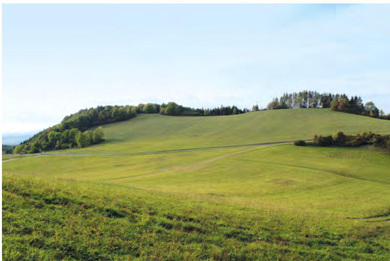
↑ Hradiště Požaha, pohled od jihovýchodu. Foto M. Zezula 2015