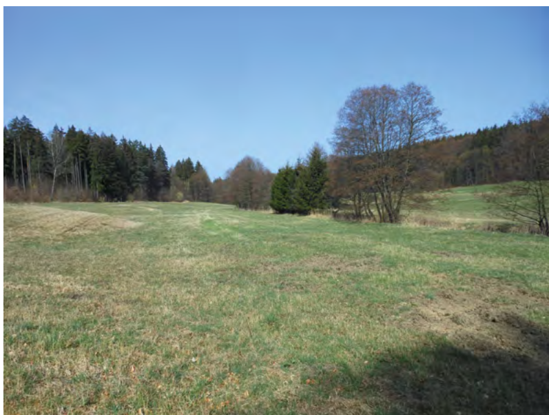
↑ Pohled na lokalitu od jihovýchodu. Foto R. Stránská 2015

Popis: Vesnice byla založena v údolí po obou březích Rakoveckého potoka, v nadmořské výšce 451–462 metrů, na cestě spojující dvě středověká centra – Jedovnice s tvrzí a Račice s hradem. Dnes se jedná o plochu přibližně 600 x 200 metrů, na jejíž jižní straně jsou patrné výrazné terénní vlny, které byly využity pro stavbu domů.