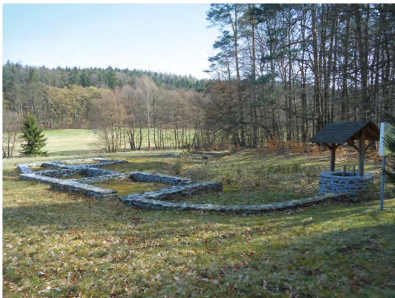
↑ Prezentace základů usedlosti č. X. 2015