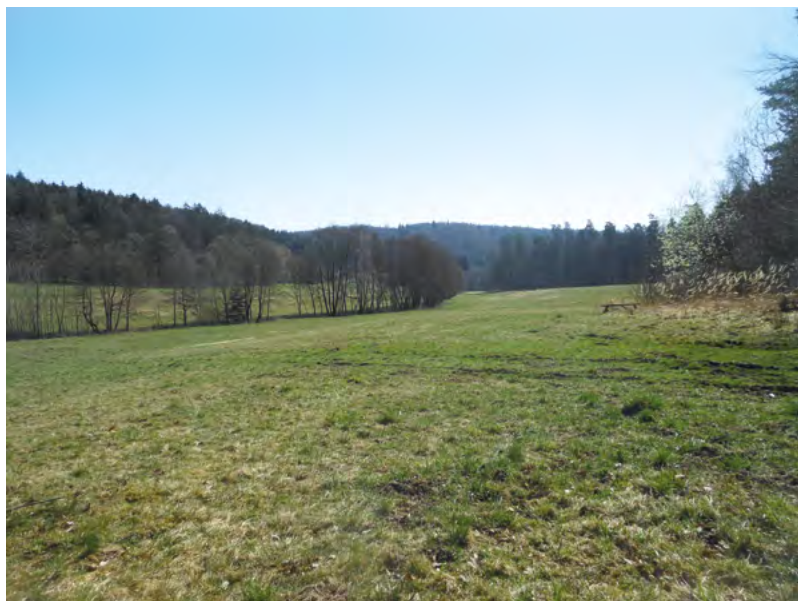
↑ Pohled na lokalitu od severozápadu. Foto R. Stránská 2015

se záplav v důsledku odlesnění svahů nad nimi. Nové usedlosti vznikly na méně strmé západní straně údolí a jejich rozmístění respektovalo průběh potoka a terénní konfiguraci. Zástavbou obou břehů potoka se vesnice řadí mezi dlouhé lesní lánové vsi.