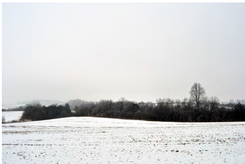
↑ Centrální plocha hradisko. Foto R. Biško 2011