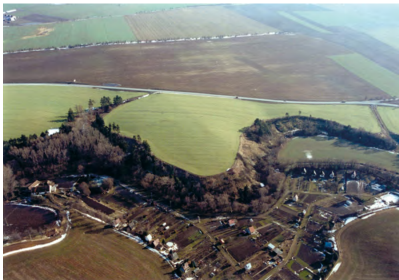
↑ Letecký pohled na hradisko od západu. 2000