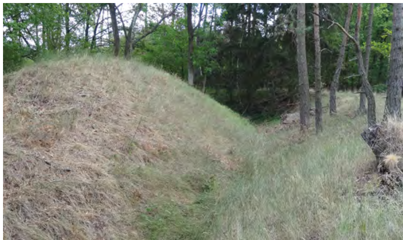
↑ Dočasné opevnění (3) nad zaniklou vesnicí. Foto A. Knechtová 2015