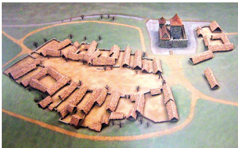
↑ Model zaniklé vsi Mstěnice.