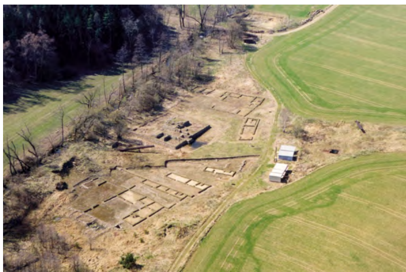
↑ Letecký snímek zaniklé vsi s prezentovanými základy domů a relikty tvrze, v horní části výzkum vodního mlýna. Foto M. Bálek 2000

vyskytovaly i dvojdlílné domy, kterým chyběla komorová část, což svědčí o sociálních rozdílech mezi obyvateli. Byly objeveny i domy jednoprostorové, které netvořily samostatnou jednotku, ale patřily k jednotlivým usedlostem snad jako výměnek. Stěny staveb byly buď zděné z kamene na hlinu, nebo byly roubené. Obytné části