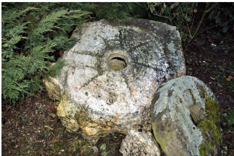
↑ Dolní Dlouhá Loučka, středověký mlecí kámen z mlýna na rudu.