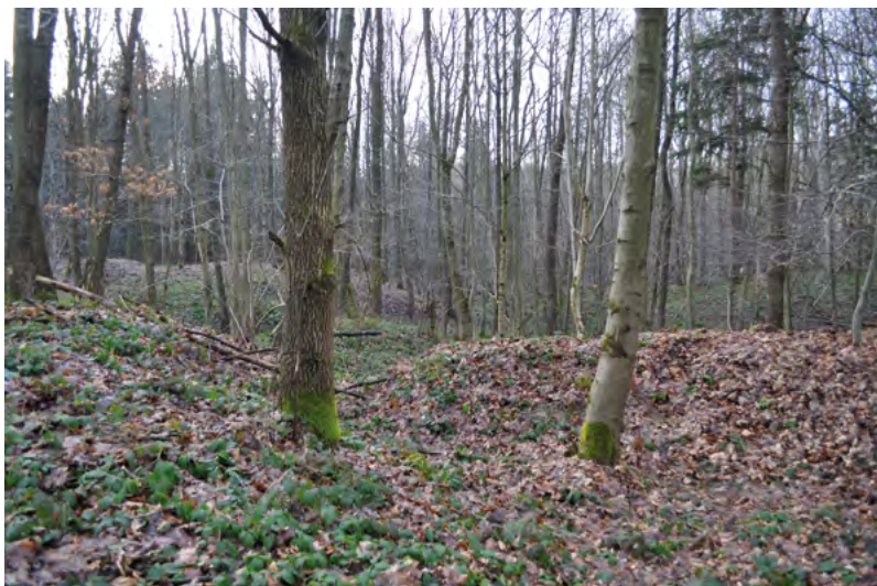
↑ Zvlněná krajina rýžoviště.

těžbou, např. jednoduchým rýžováním miskou, případně zdokonalenou technikou rýžování pomocí rýžovníckého splavu s umělým přítokem vody. Pozůstatky po rýžování zlata na Oskavě v podobě *sejpů a hromad hlušiny se vyskytují podél toku již od obce Bedřichov až k odbočce silnice na Mostkov z Oskavy do Libiny. Jižně od této odbočky silnice na Mostkov se po obou stranách dnešního toku Oskavy na ploše cca 0,55 km 2 v délce zhruba 1100 m po proudu říčky Oskavy nachází v lužním lese rozsáhlé rýžoviště široké zhruba 500 m (A). Těžební areál se nachází na rozmezí Hanušovické vrchoviny a Nížkého Jeseníku v nadmořské výšce 290 m, asi 11 km severně od historického jádra Uničova. V minulosti bylo rýžoviště rozsáhlejší, jak o tom svědčí pozůstatky rýžovníckých kopečků a šterkového zvrstvení vhodného k těžbě i východně od silnice vedoucí z Oskavy do Dolní Libiny. Těžební (tzv. sejpové) pole tvoří rýžovnícké kopečky (tzv. sejpy), což jsou haldy hlušiny, šterku a písku, vzniklé jako odpad z těžby rýžováním. Tyto kopečky prorýžovaného materiálu jsou velmi dobře dochované a dosahují výšky kolem 4–5 m. Obsahují valouny o rozměrech od 2 do 40 cm a jemný šterk. Kromě rýžovníckých kopečků (sejpů) se zde dochovaly také umělé přírodní kanály, sloužící k propírání sedimentů a odvodňování, což umožnilo povrchovou těžbu i do větších hloubek a použití rýžovníckého splavu. Vznikly tak hluboké brázdy dosahující místy až 4 m hloubky. Jak ukázal geologický