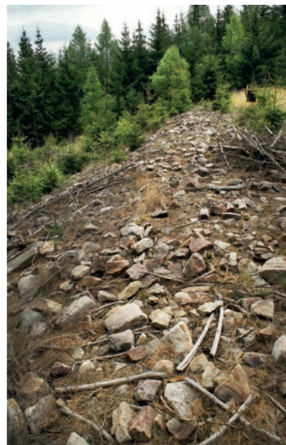
↑ Kamenný val na východní straně vnitřního hradiště – akropole.

Ve vnějším i vnitřním opevnění se nachází vždy jen jeden bezpečně prokázaný vstup, další přerušení valů jsou pravděpodobně novodobá. Vstup do předhradí vedl od jihu, a to poblíž místa, kde do hradiště vchází hlavní přístupová cesta (červená turistická značka; dnešní cesta ovšem vstupuje druhotným proražením valu). Tomuto místu se tradičně říká Stará vrata (A) a vážou se k němu nálezy několika bronzových depotů; vně před touto branou byly nedávno nalezeny také bronzové slitky. Brána vnějšího ohrazení bývá někdy popisována jako ulicového typu (*brána ulicovitá), u nějž dvojice za sebou postavených hradeb vytvářela jakousi ulici. V současné době je ovšem val v okolí na-