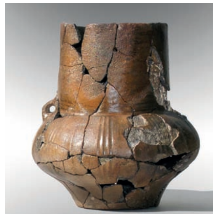
↓ Amfora mladší doby bronzové z vývratu v areálu hradiště; nalezl M. Gelnar kolem r. 2000. Výška nádoby 173 mm. Hornické muzeum Příbram, inv. č. 37605. Foto M. Kuna, 2004.