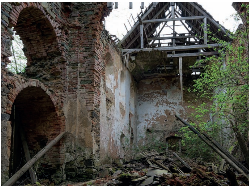
↖ Kostel sv. Anny se hřbitovem na vrchu nad obcí.

[7] Milíře u Tachova (TC), zaniklá pila: N 49°48'07.21", E 12°31'48.02" (9,4 km).