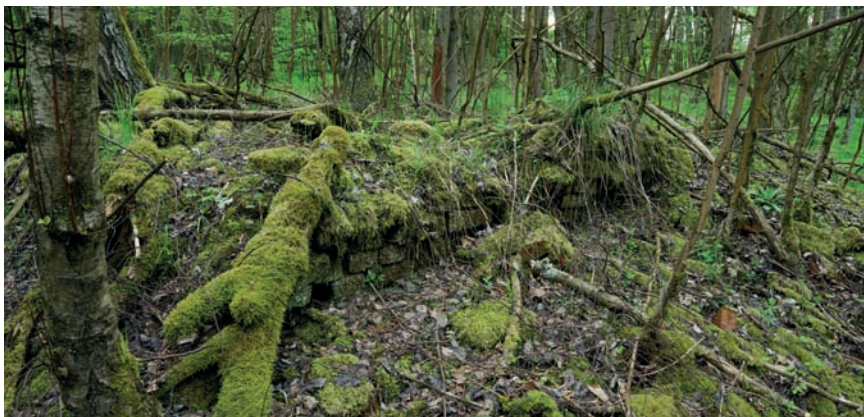
↓ Zbytky zdiva jednoho ze zanikajících domů, vytvářející typický destruktční kužel. Foto Z. Kačerová, 2013.