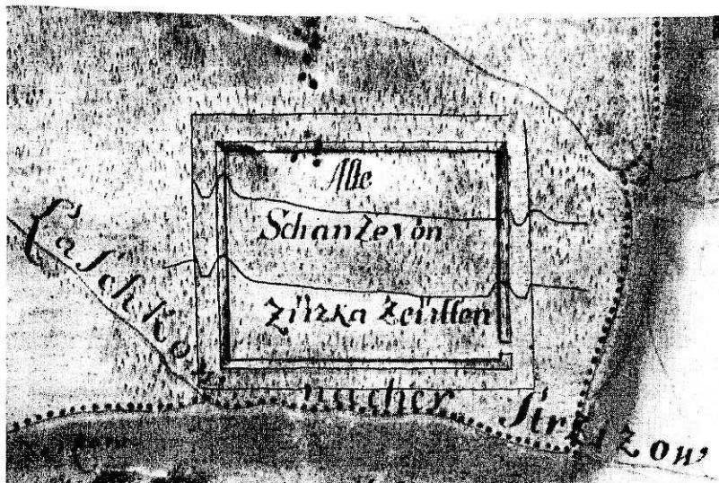
Obr. 1. Výsek z mapy náměšťského panství z r. 1746. — Ausschnitt aus der Karte der Herrschaft Náměšť 1746.

na mapách prvního (1781) i druhého (1838—1842) vojenského mapování a je zaznamenán i na nejnovějších mapách (1 : 10 000 M-33-95-A-a-3, 1 : 25 000 M-33-95-A-a Náměšť na Hané, 1 : 50 000 M-33-95-A Olomouc-západ). Stručná zmínka o lokalitě a její ztotožnění s keltskými Viereckschanzemi byla publikována nedávno ( Drda - Waldhauser - Čizmář , AR XXIII, 1971, 290, Abb. 2 : 13).